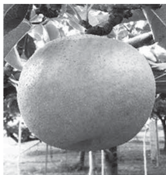
第1図 加賀しずく（カラー図表をHPに掲載C123）

加賀しずくの出荷には糖度12度以上という基準を設けていることから、生産当初は約3割が出荷品質基準に達しないなどの課題があった。これら規格外品の活用方法としてペーストへの加工を行ったものの、ペーストでは果肉の原型がなく食感が失われてしまい加工できる菓子の幅が狭まっ