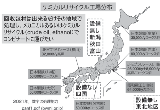
第16図 現在のケミカルリサイクル工場 (カラー図表をHPに掲載C132)

国内でこの方法が具現化したらどのような情報が多く公開されていないが想定してみたい。家庭から排出されるプラスチック製容器包装の中にどのような包材が含まれるのか。まずピロー包装やパウチの大きいものは回収資源に含まれるが、PTPは残念ながら小さいので家庭ゴミの中に排出されることが多いだろう。たとえプラスチック製容器包装の中にあつたとしても、選別のベルト