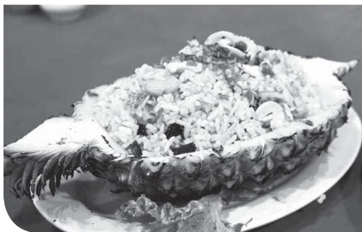
「カオバット・サバロット」プーケット (タイ) KT